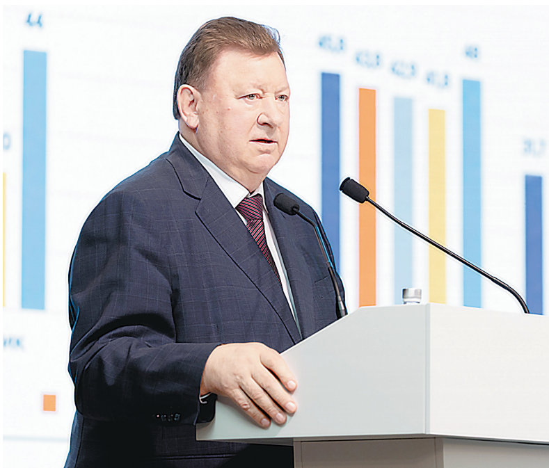
Доклад заместителя Председателя ЦК КПРФ, Председателя Комитета Государственной Думы по аграрным вопросам, академика РАН В.И. Кашина на итоговом заседании Коллегии Минсельхоза России.

– Сегодняшнее собрание, посвященное развитию агропромышленного комплекса, стало для меня, как и для многих присутствующих, кто посвятил свою жизнь этой важнейшей отрасли и аграрной науке, источником глубокого удовлетворения.