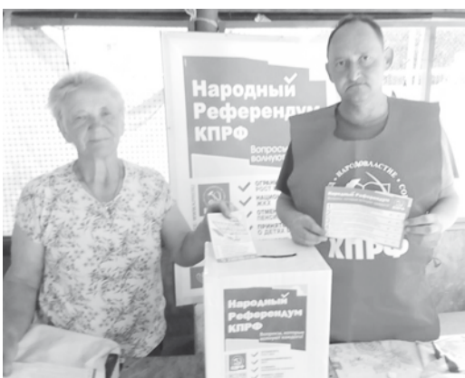
По материалам пресс-групп местных отделений КПРФ

Коммунисты по всей области ходят к населению с газетами «Наш голос» и «Правда».