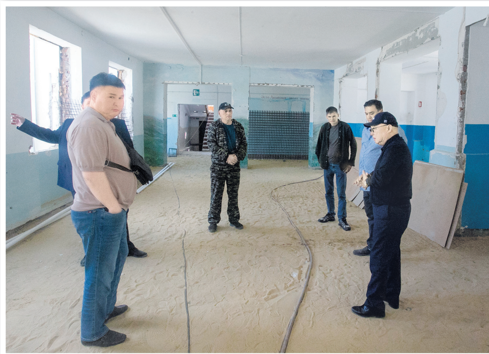
В здании Эсто-Алтайской средней школы проводится капремонт

на что обратили внимание строители – это своевременное финансирование работ. Если данное условие будет обеспечено, проблем - ни по качеству, ни по срокам - не возникнет.