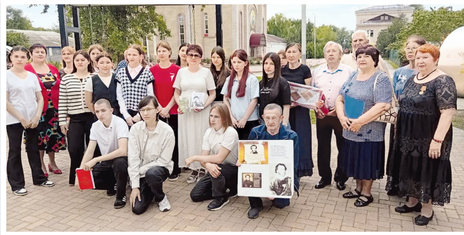
Участники праздника в Городовиковске, посвященного Дню русского языка

Так уж бывает, к великому сожалению, что героическое и трагическое