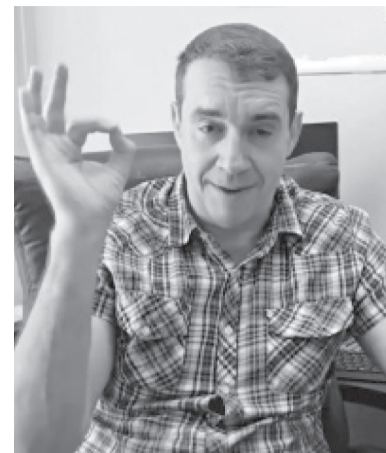
Пресс-служба фракции КПрФ в Саратовской облдуме

оказались в подвешенном состоянии. Ни комитет по аграрным вопросам областной думы, ни правительство об этом не задумались.