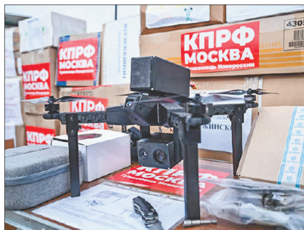
Стр. 4 – 152-й гуманитарный конвой