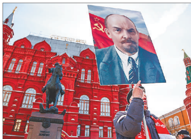
Стр. 2 – Твои права – его декреты