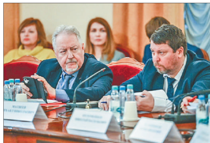
Стр.6 – Патент на проблемы