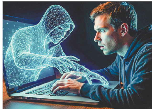
Стр. 4 – Эволюция обмана