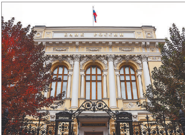
Стр. 2 – Стана кредитов