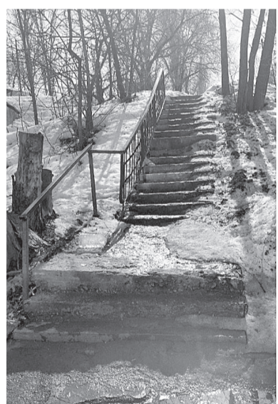
Буду держать ситуацию на особом контроле!

По всем вопросам, поступившим от жителей, направляю депутатские запросы в администрацию города: срочно проверить состояние дороги у ОКБ и привести её в нормативное состояние, обустроить тротуар и установить пешеходный переход для безопасности детей, ливнеприёмную систему, чтобы окончательно решить эту проблему.