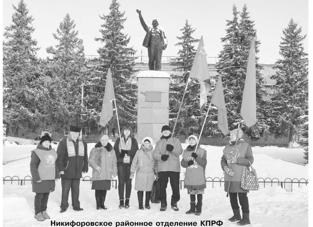
Никифоровское районное отделение КПРФ

КПРФ сегодня – это прямой и единственный продолжатель великого дела Коммунистической партии, которая была создана Владимиром Ильичом. В ней приходят новые бойцы. Они убеждены, что Россия справится со всеми вызовами времени и задачами истории, вернёт себе вновь статус мировой державы, став социалистической, как это и было в лучшие годы её развития. Ради этого стоит жить и бороться. Бороться, беря пример с Ленина! И сегодня в политический бой за остро необходимые социалистические преобразования мы идём с проверенной жизнью Программой Победы КПРФ и твёрдо знаем, что в итоге обязательно победим!»