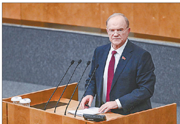
Стр. 4 – Геннадий Зюганов: «Уважают только сильных и умных»