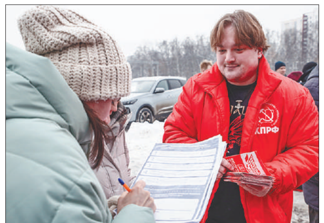
Стр. 5 – Народный референдум