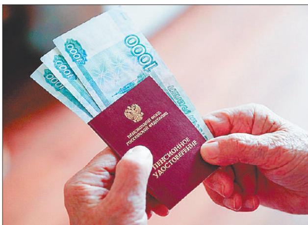
Стр. 2 – Забота на две тысячи рублей