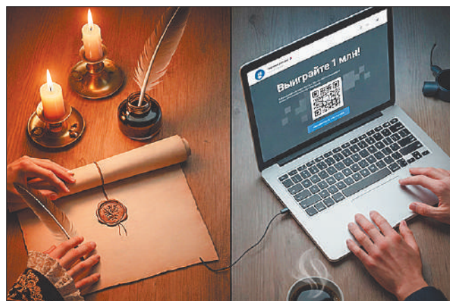
Стр. 8 – Борьба с мошенничеством или с прогрессом?