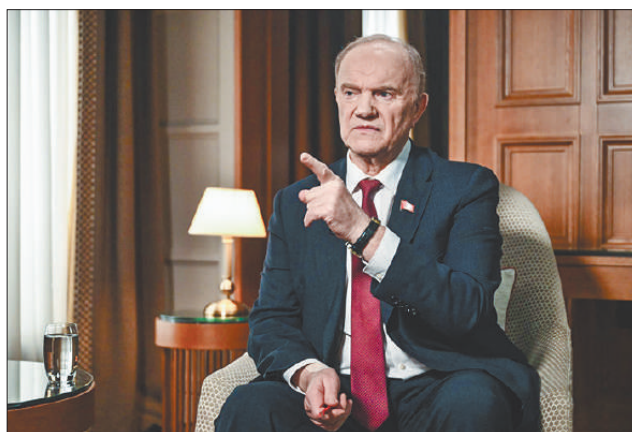
Стр. 3 – Геннадий Зюганов об итогах прошлого года