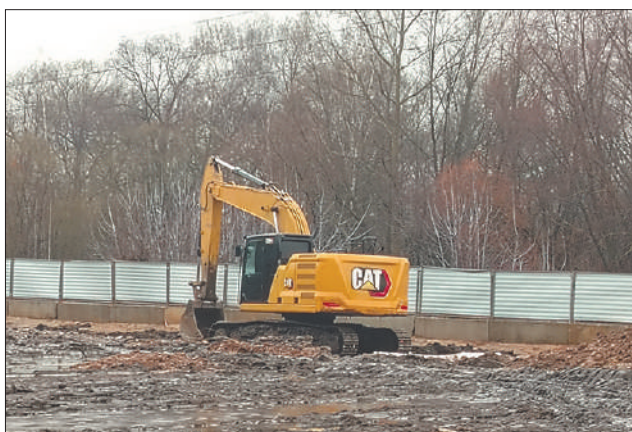
Стр. 7 – Долина реки Сетунь: узаконенный экоцид