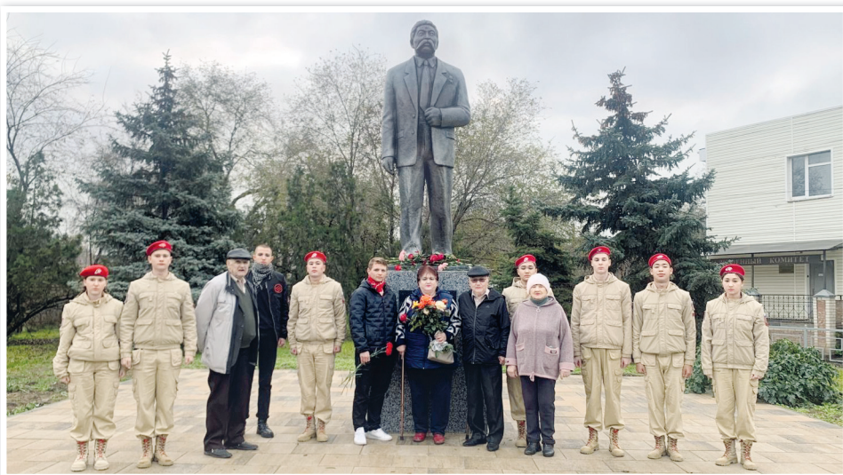
У памятника Б.Б. Городовикову в городе Городовиковске

зыву» в Калмыкию ехали специалисты со всех регионов. Сейчас, к сожалению, все наоборот.