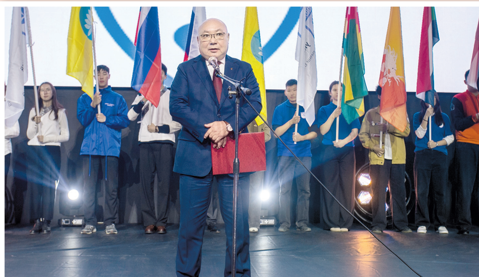
Участников форума поздравил вице-спикер парламента Калмыкии Николай Нуров

Вице-спикер огласил приветственный адрес парламента Калмыкии