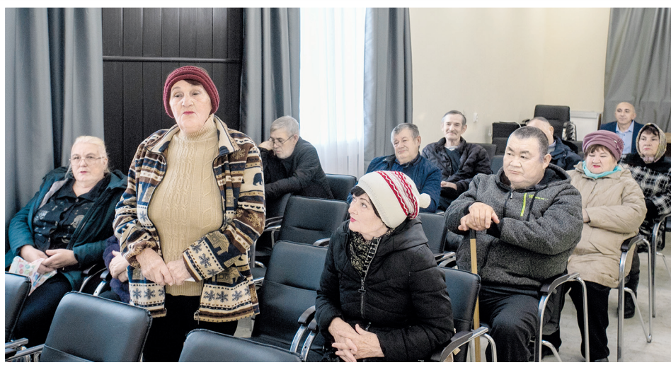
Участники встречи с депутатом в селе Приютное