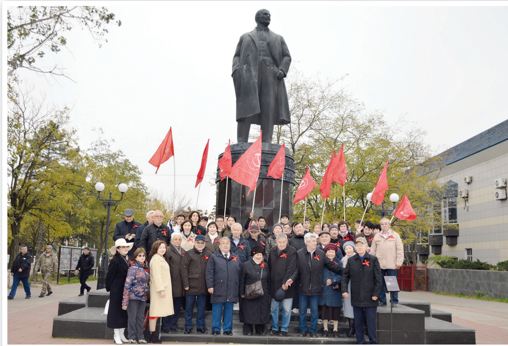
Участники торжеств в Элисте

7 ноября коммунисты Калмыкии и их сторонники, комсомольцы и гражданские активисты провели в Элисте торжественные мероприятия, посвященные 108-й годовщине Великой Октябрьской революции.