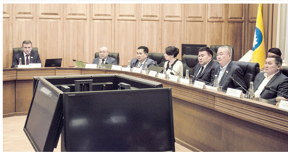
В зале заседаний Народного Хурала