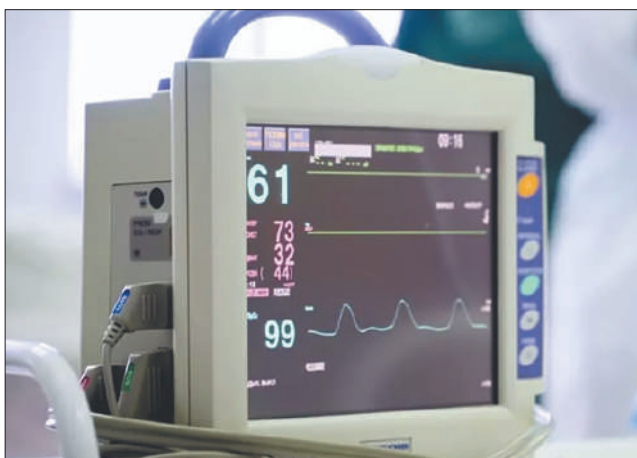
Стр. 3 – Медицинский коллапс