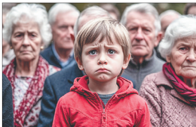
Стр. 4 – Борьба с демографической катастрофой