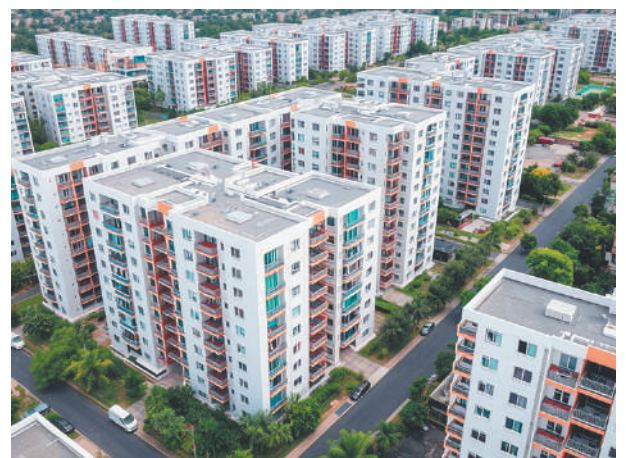
Стр. 5 – Почему дорожает жильё?