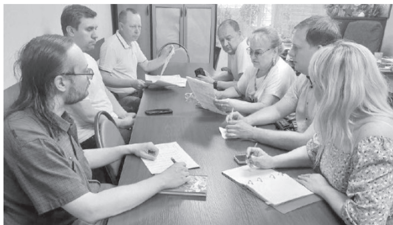
В Саратовском обкоме КПРФ прошло очередное заседание штаба по выбо-

рам 2025—2026 годов. Главной темой обсуждения стал ход выполнения на-