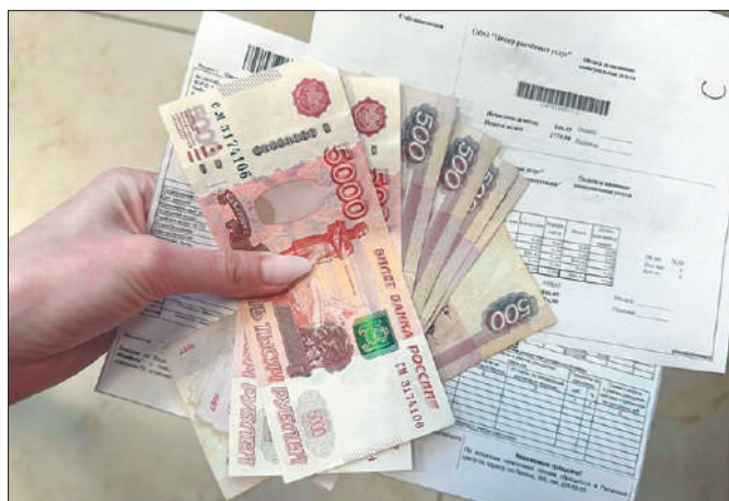
Стр. 4 – ЖКХ-удар