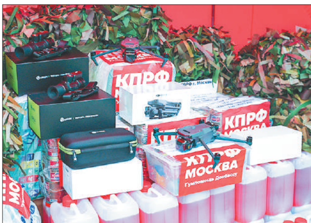
Стр. 2 – КПРФ помогает Донбассу!