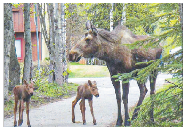
Стр. 8 – Оставьте в покое Лосиный остров