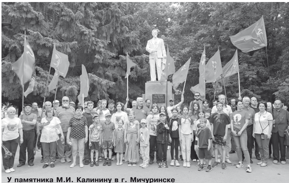
У памятника М.И. Калинину в г. Мичуринске