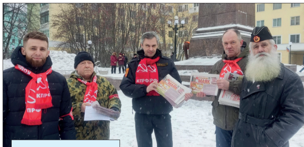
2 марта 2025 года

Понятно, что при таком отношении власти к инициативе коммунистов Первомай не стал общегородским праздником.