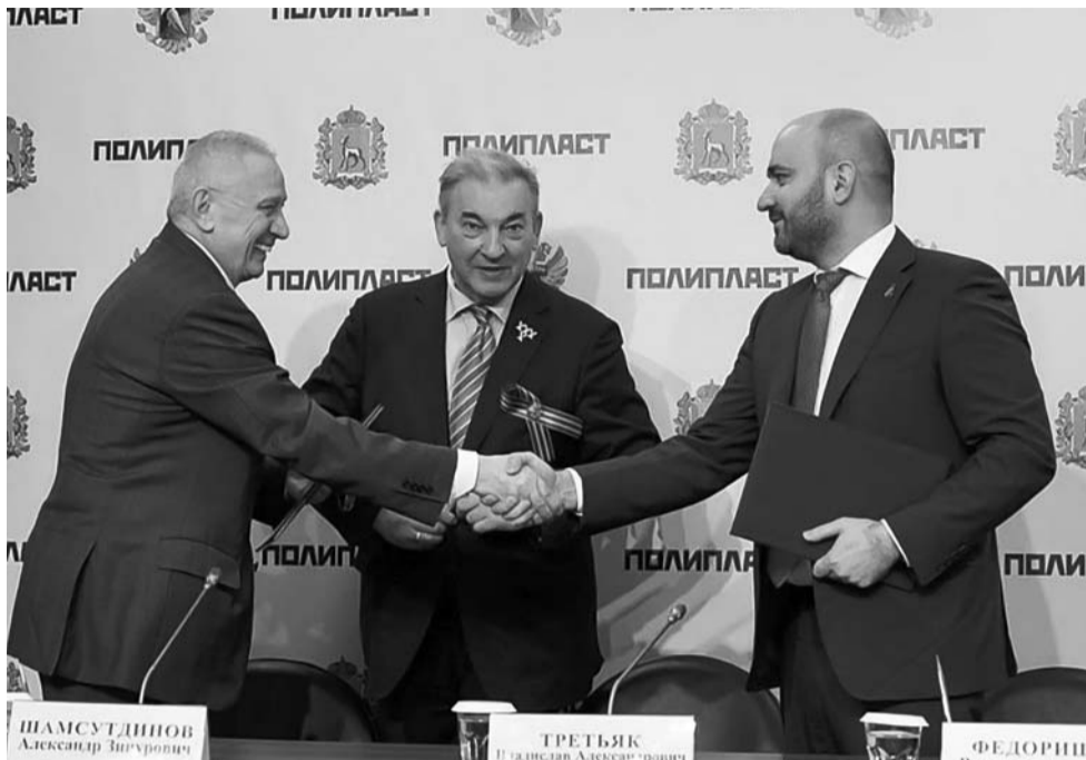
Вячеслав ФЕДОРИЩЕВ, губернатор Самарской области:

Компания «Полипласт» – ведущий российский производитель химической продукции для различных отраслей промышленности Российской Федерации. Одним из ключевых направлений социальной политики холдинга является популяризация спорта, здорового образа жизни, развитие профессионального и любительского хоккея.