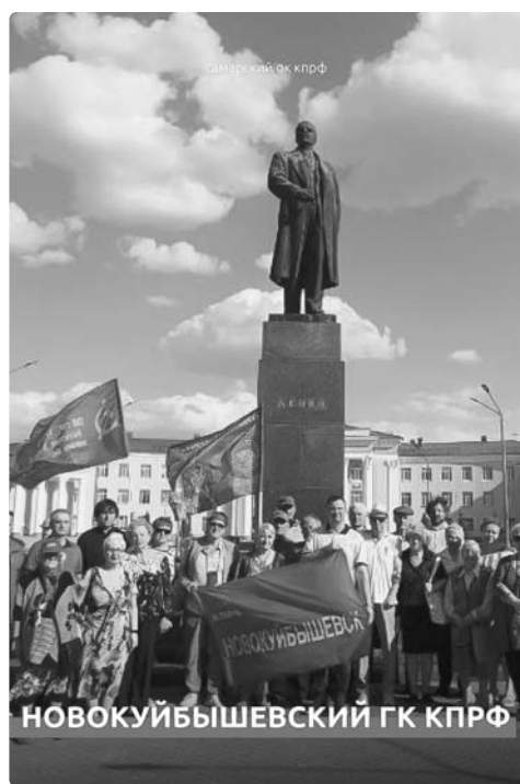
НОВОКУЙБЫШЕВСКИЙ ГК КПРФ