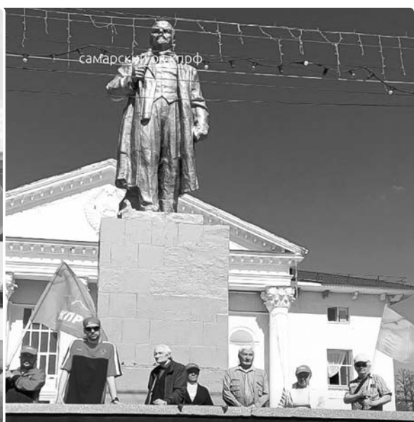
ПОХВИСТНЕВСКИЙ ГРК КПРФ