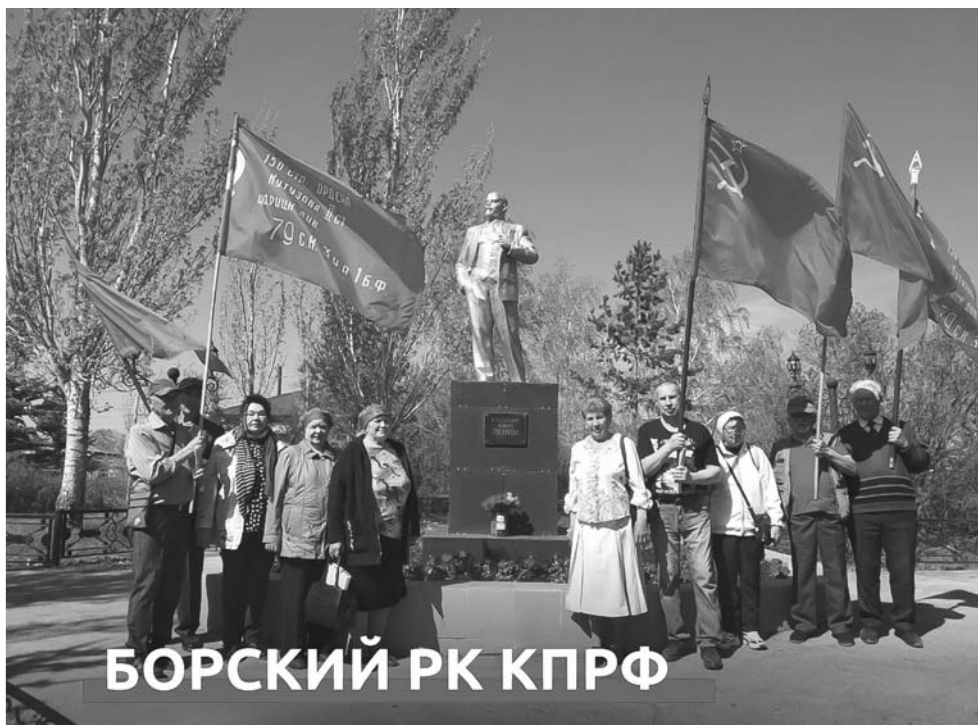
БОРСКИЙ РК КПРФ

На фотографиях торжественные мероприятия в Новокуйбышевске, Нефтегорске, Отрадном, Похвистневке, а также в Богатовском, Приволжском, Борском и Камышлинском районах.