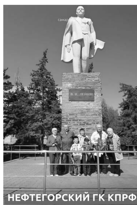
НЕФТЕГОРСКИЙ ГК КПРФ