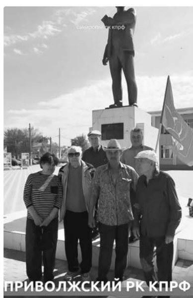
ПРИВОЛЖСКИЙ РК КПРФ