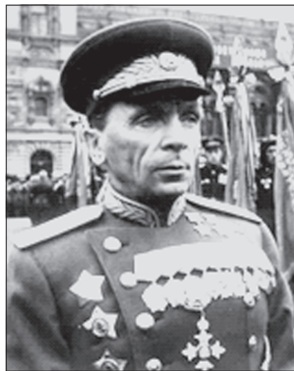
Прославленный полководец П.И. Батов на параде (Москва, Красная площадь, 24 июня 1945 г.).

По окончании Сталинградской битвы войска 65-й армии вошли в образованный новый Центральный фронт. За организацию четкого взаимодействия подчиненных войск при форсировании Днепра, прочное удерживание плацдарма на западном берегу реки и проявление при этом личной отваги и мужество Указом Президиума Верховного Совета СССР генерал-лейтенант П.И. Батов был удостоен звания Героя Советского Союза с вручением ордена Ленина и медали "Золотая звезда".