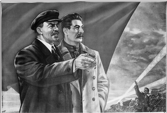
СЛАВА ВЕЛИКИМ ВОЖДАМ ОКТЯБРЯ!