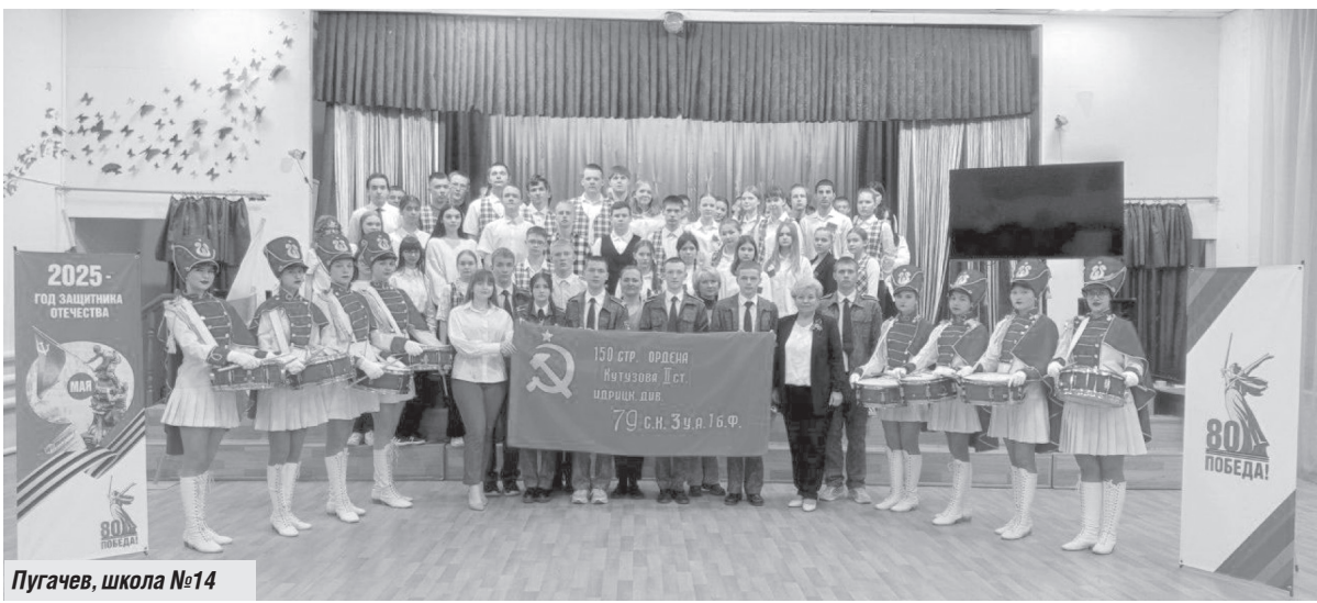
Пугачев, школа №14

В День международной солидарности трудящихся энгельские коммунисты провели серию одиночных пикетов, чтобы напомнить всем о важности борьбы за социальную справедливость и улучшение жизни простых людей. Коммунисты всегда выступают за права трудящихся, против эксплуатации и неравенства, будут стоять на страже интересов народа и бороться за светлое будущее для всех. Верим, что наша борьба не напрасна, призываем всех присоединиться к нашему движению за справедливость и равенство!