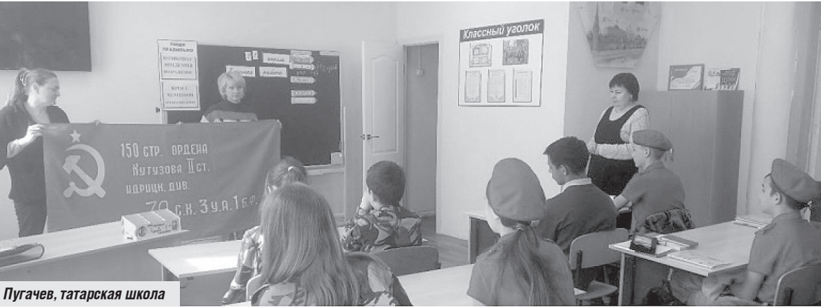
Пугачев, татарская школа

войны, об акции, проводимой Саратовским обкомом КПРФ «Знамя Победы — в каждую школу» и торжественно передал Знамя Победы студентам БФ СГЮА. В Пугачеве активисты КПРФ побывали в школе-интернате, где поздравили ребят с Днём Победы и вручили им копию Знамени Победы. Здесь учатся не только дети-сироты, но и дети с ограниченными возможностями. Также вручение копии Знамени Победы состоялось в школах № 4 и № 14. В аграрно-технологическом техникуме г. Пугачева также состоялась торжествен-