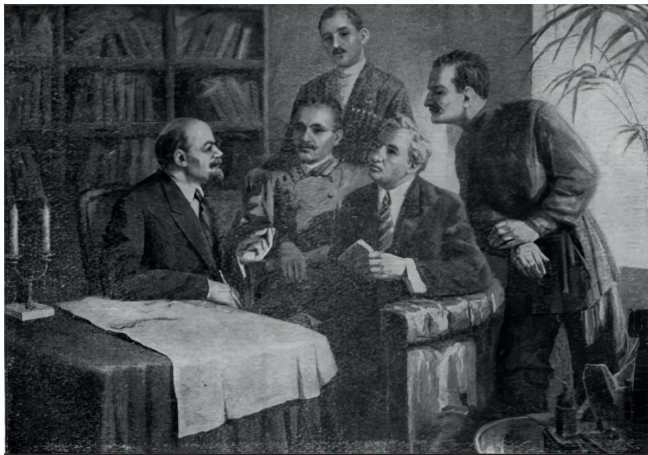
ДАГЕСТАНСКАЯ ДЕЛЕГАЦИЯ У В.И. ЛЕНИНА. ФЕВРАЛЬ 1920 Г.

но, высокохудожественно эту слитность чеканными и ёмкими словами выразил выдающийся поэт Владимир Маяковский: