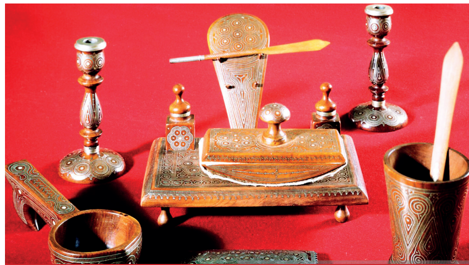
ПИСЬМЕННЫЙ ПРИБОР - ПОДАРОК ТРУДЯЩИХСЯ ДАГЕСТАНА В.И. ЛЕНИНУ (1921 Г.). ИЗ ФОНДОВ МУЗЕЯ «КАБИНЕТ И КВАРТИРА В.И. ЛЕНИНА В КРЕМЛЕ».

ветским государством во весь рост встали задачи мирного хозяйственного строительства. Однако на этом пути встали гигантские трудности, ибо народное хозяйство было разорено. В то же время Владимир Ильич считал, что страна имеет всё необходимое и достаточное для построения социализма. Главная задача, указывал он, состоит в том, чтобы восстановить и дальше развить промышленность, особенно тяжелую, ликвидировать технико-экономическую отсталость, выйти в число передовых стран. Для этого необходимо индустриализировать и электрифицировать всю страну, осуществить коллективизацию крестьянских хозяйств и развить культурную революцию — указывал Ленин.