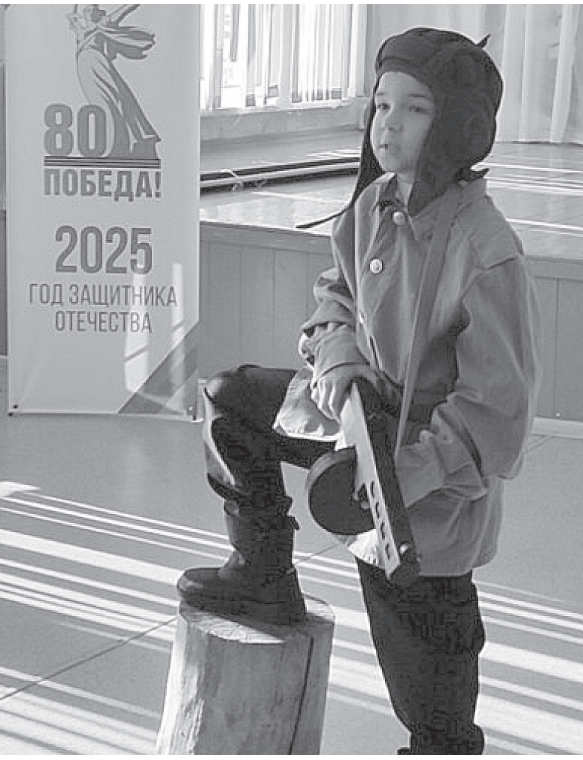
Пресс-служба Саратовского обкома КПРФ

Ширится пропасть между богатыми и бедными, но ещё больше становится пропасть между реальностью и официальной информацией, между правдой и вымыслом направленного действия.