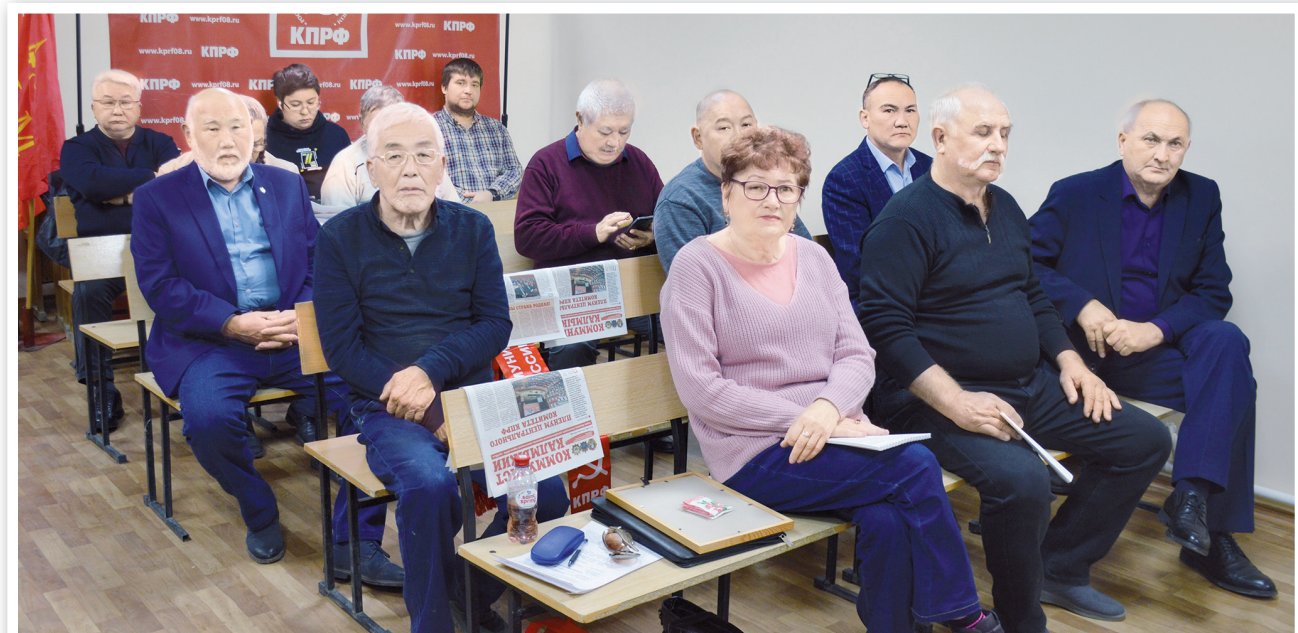
Участники совместного пленума Комитета и КРК КРО КПРФ

В наши дни представители Калмыкии воюют за свободу Донбасса, многие из них награждены орденами и медалями, а