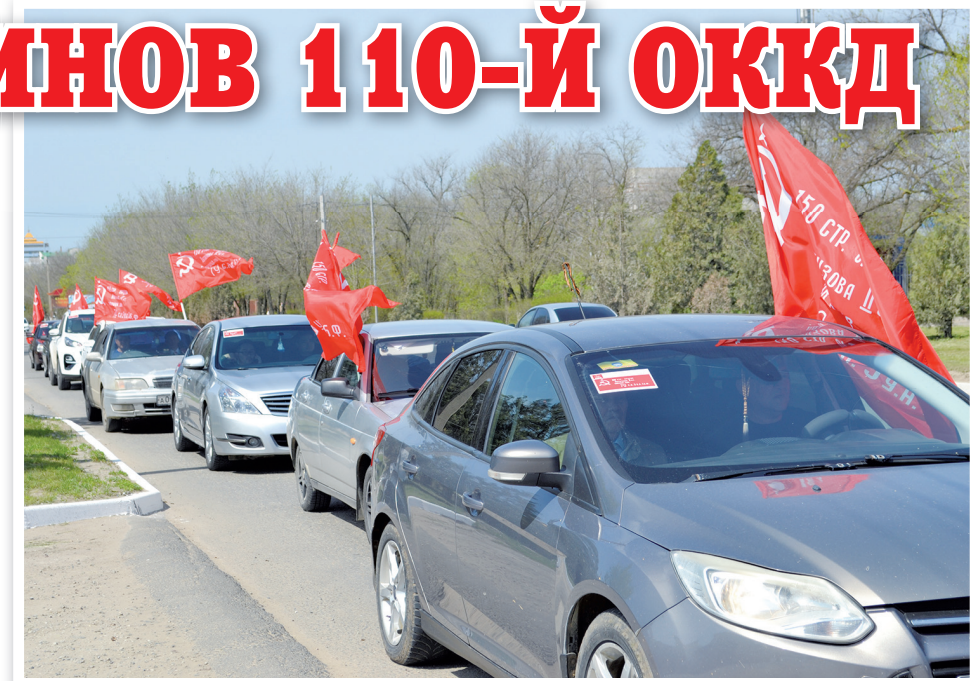
Автопробег в столице Калмыкии – Элисте

В боях на донских рубежах, с 18 по 27 июля 1942 года, 110-я ОККД уничтожила до 4 батальонов мотопехоты, 30 танков, 55 бронемашин, 45 миномё-