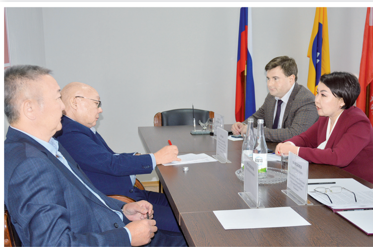
Встреча с членами фракции КРО КПРФ

До начала сессии кандидат на должность премьер-министра