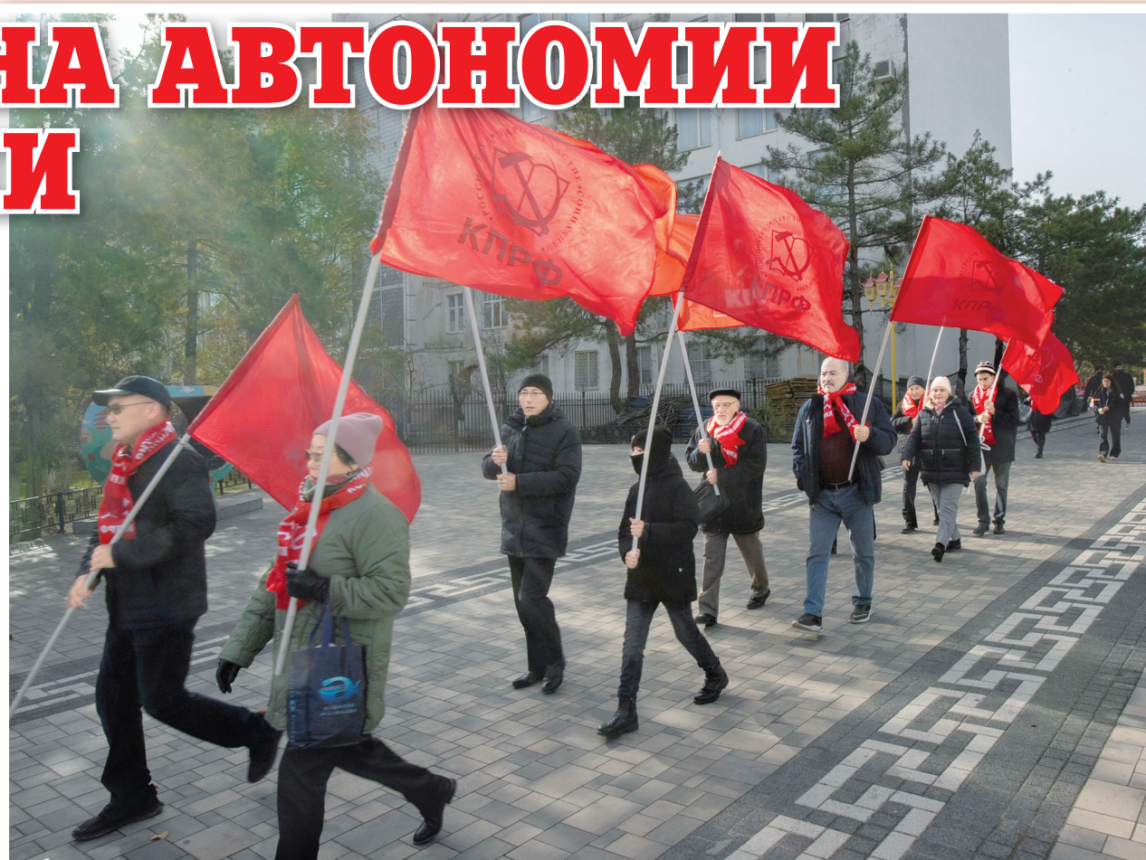
Участники торжественного мероприятия на пути к Аллее Героев

Этому историческому событию предшествовало Воззвание В.И. Ленина к калмыцкому трудовому народу, гарантировавшее калмыцкому народу неприкосновенность его прав на равенство со всеми народами Советской России. А также I Общекалмыцкий съезд Советов, утвердивший текст «Декларации прав трудового калмыцкого народа», подготовленный группой коммунистов. Итогом этой грандиозной работы стало объединение всех разрозненных частей