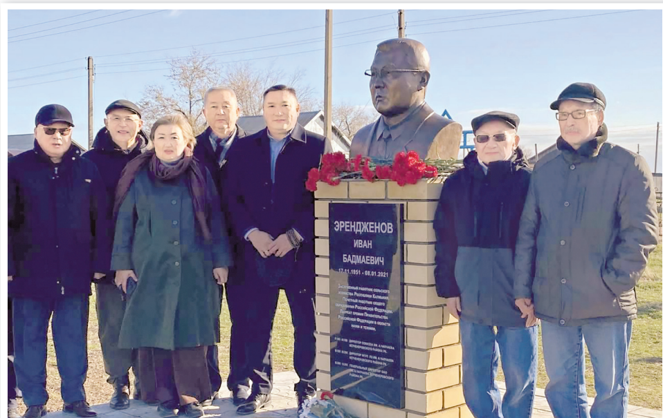
Участники мероприятия в Алцынхуте Кетченеровского района

17 ноября члены фракции КРО КПРФ в Народном Хурале - вице-спикер парламента Николай Нуров и председатель комитета по законодательству, государственному строительству, местному самоуправлению и противодействию коррупции Петр Эрендженев приняли участие в открытии памятника Ивану Эрендженеву в поселке Алцынхута Кетченеровского района.