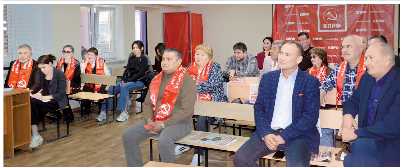
Делегаты конференции Элистинского местного отделения КПРФ

В ходе проведения отчетно-выборных собраний значительно обновился состав секретарей «первичек», которые возглавили молодые, но уже имеющие