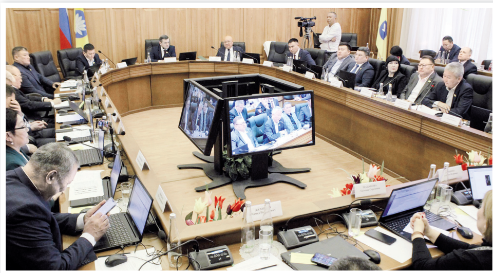
В зале заседаний парламента Калмыкии