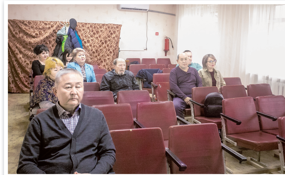
Участники встречи в селе Садовое

Наряду с этим выражались опасения по поводу подготовки специалистов на недавно открытом медицинском факультете Калмыцкого госуниверситета. Каково качество преподавания, располагает ли вуз соответствующим профессорско-