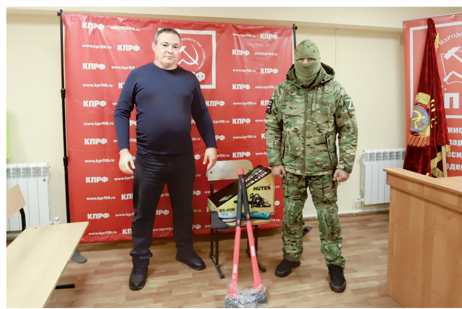
Первый секретарь Элистинского горкома КПРФ с участником СВО