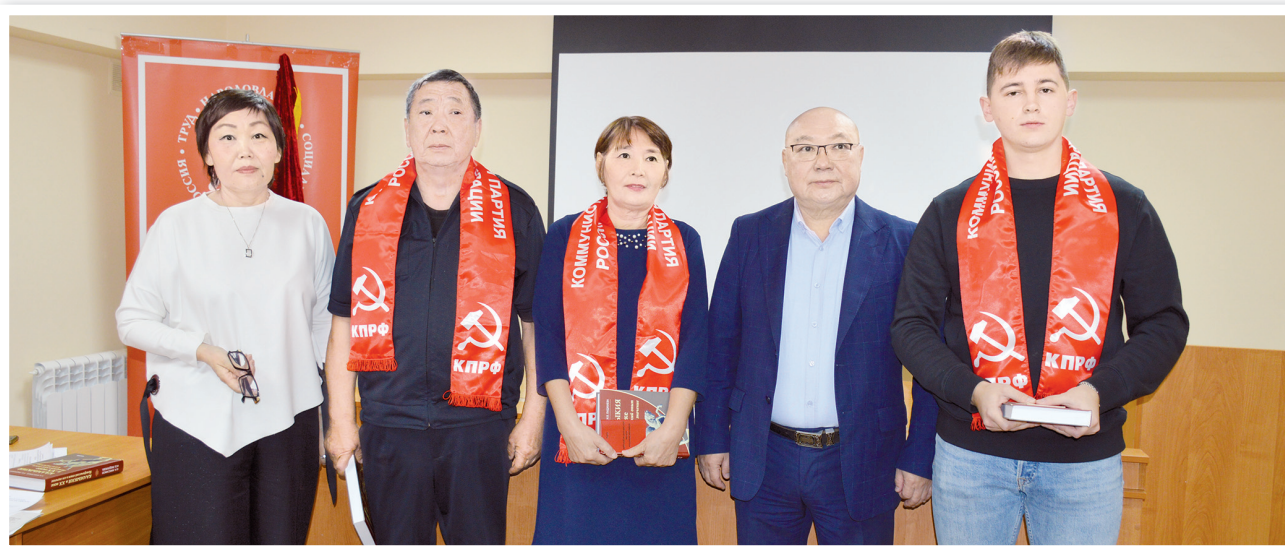
Церемония вручения партийных билетов