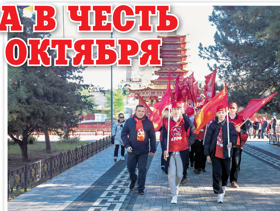
Участники торжеств в Элисте

Участники торжеств приняли резолюцию, в которой