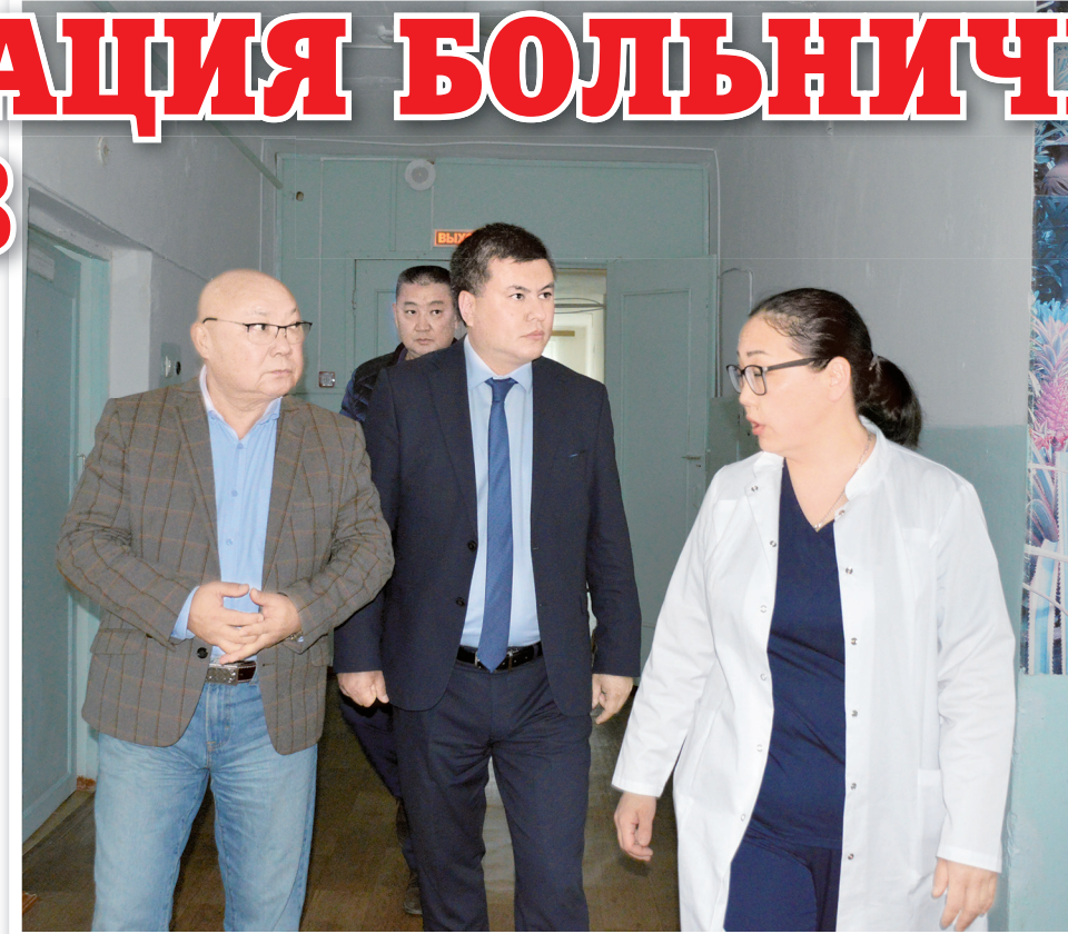
Осмотр помещений Ики-Бурульской больницы