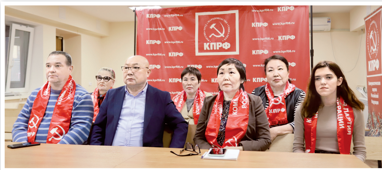
Участники общероссийской партийной учебы