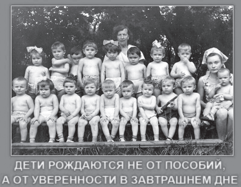
ДЕТИ РОЖДАЮТСЯ НЕ ОТ ПОСОБИЙ, А ОТ УВЕРЕННОСТИ В ЗАВТРАШНЕМ ДНЕ

ской области умолчал об эффективности реализации национального проекта «Демография», учитывая поставленные цели и результаты. Ещё в июне депутат Госдумы от КПРФ Нина Останина , выступая на пленарном заседании нижней палаты парламента в ходе Правитель-