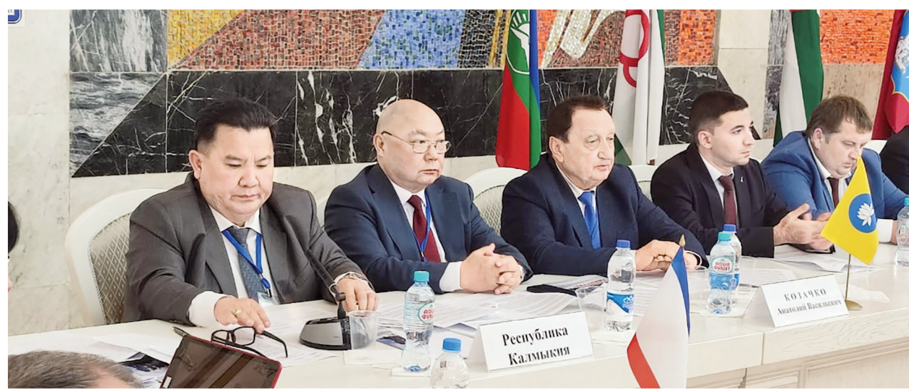
Члены делегации парламента Калмыкии

кодекса и освободить детей из многодетных семей от уплаты пошлины за выдачу паспорта гражданина Российской Федерации.