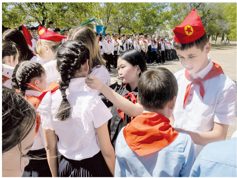
Как повяжешь галстук - береги его...

С не меньшими эмоциями был воспринят участниками торжественной линейки подарок рескома партии: беспроводная звукоусиливающая аппаратура. Ценные подарки СОШ им. Г.К. Жукова от КРО КПРФ в День пионерии стали за