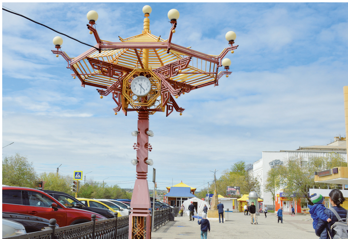
Часы "Эрдни цаг" в центре Элисты давно остановились