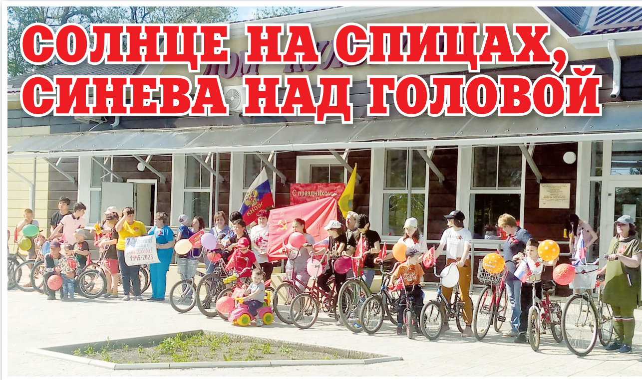
Участники велопробега в поселке Розенталь

6 мая в поселке Розенталь Городовиковского района состоялся традиционный велопробег, приуроченный к празднованию 78-й годовщины Победы в Великой Отечественной войне. Среди его участников были жители поселка: школьники, родительское сообщество и самые юные розентальцы, младшим из которых по три - пять лет.