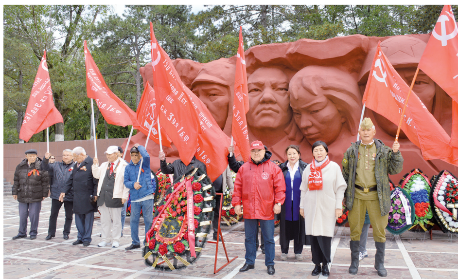
Участники торжеств в Элисте

настроение поздравление с праздником от шедшего с отцом малыша. На вопрос: «А знаешь, какой сегодня праздник?» мальчуган громко и уверенно ответил: «День Победы!». Отдавая дань памяти погибшим за Родину вои-