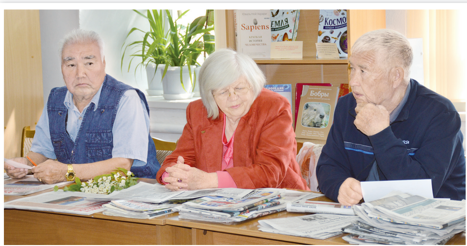
Делегаты конференции Яшкульского местного отделения партии

Обращаясь к участникам мероприятия, глава коммунистов Калмыкии кратко остановился на основных положениях нового закона РК о выборах депутатов, особенностях нарезки территориальных округов, поделился мнением о наиболее острых проблемах социально-экономического развития республики, а также о программной статье Председателя ЦК КПРФ Геннадия Зюганова «Сражаясь за Русский мир».