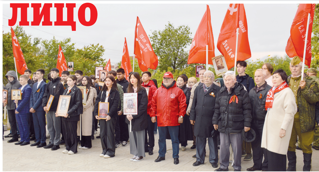
Участники митинга у мемориала в КФ МГЭУ

Бюрчиева. «День Победы бесконечно дорог всем россиянам, отцы и деды которых отстояли суверенитет и внесли решающий вклад в освобождение Европы от фашизма. Память о подвигах отцов и дедов передается из поколения в поколение, помогает, не-