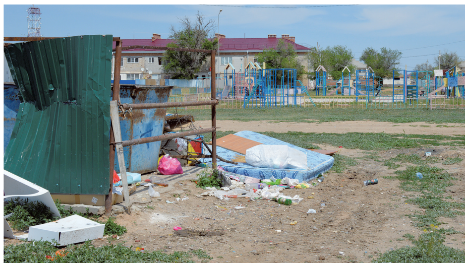
Яшкуль: мусорные контейнеры рядом с детской площадкой

на обустройство детской площадки в микрорайоне. Главная проблема здесь – расположенные неподалеку мусорные контейнеры, которые из-за своего состояния создают зону антисанитарии. На самой же детской площадке сломаны качели, обветшали и частично разрушены малые архитектурные формы. Ситуацию усугубляют расположенные с трех сторон уличные туалеты многоквартирных домов, откуда при любой розе ветров доносятся соответствующие запахи.