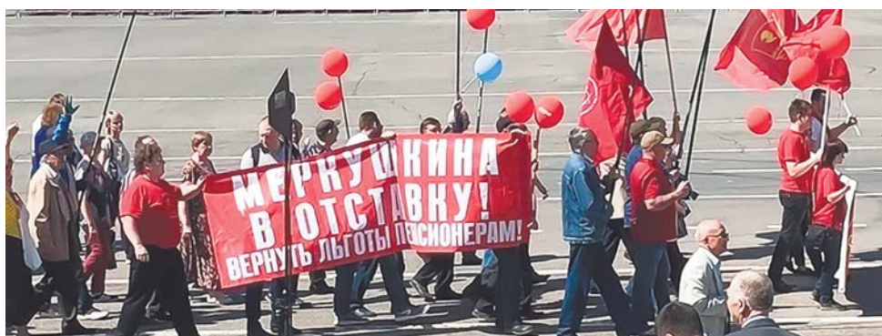
Во время «губернаторства» Николая Меркушкина жители Самарской области постоянно протестовали против его решений и требовали его отставки