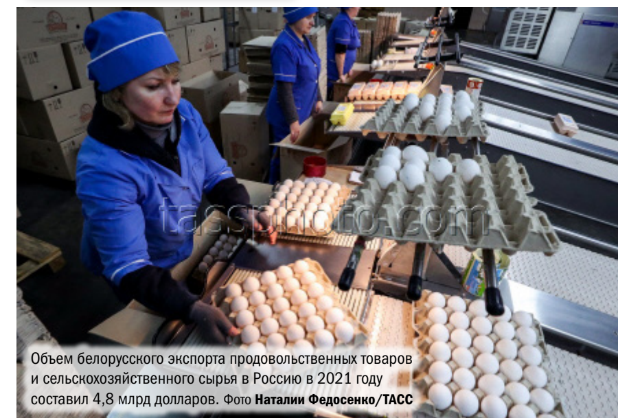
Объем белорусского экспорта продовольственных товаров и сельскохозяйственного сырья в Россию в 2021 году составил 4,8 млрд долларов.

– Расскажите, как будет решаться в условиях санкций проблема замены иностранных лекарств на российские или белорусские аналоги?