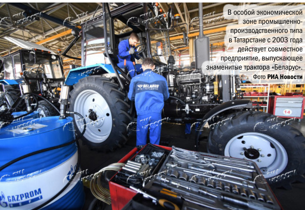
В особой экономической зоне промышленно-производственного типа в Татарстане с 2003 года действует совместное предприятие, выпускающее знаменитые трактора «Беларусь».