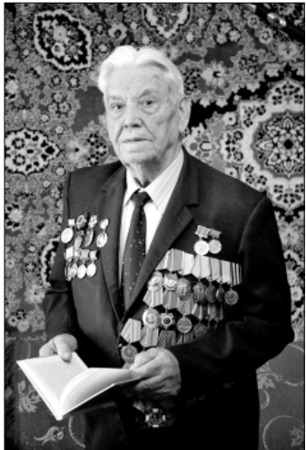
Госдума его в Основной закон включать не стала.

Деиндустриализация и «сырьёведение», отрицание протекционизма стали условиями сохранения у власти нынешних чиновников. Это даёт возможность зарабатывать деньги на контрактах, тратить их на Лазурном Берегу и владеть недвижимостью за рубежом. Между тем в поправках к Конституции не предусматривается запрет парламентариям и членам правительства владеть такой недвижимостью.