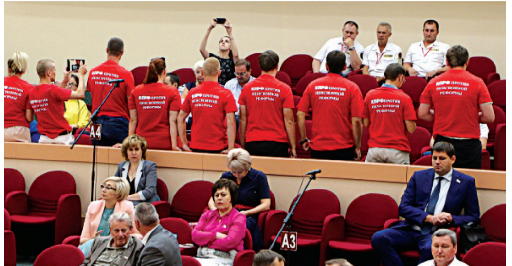
Митинг против пенсионной реформы. Саратов, 28 июля 2018 г.

Для того, чтобы не дать коммунистам развернуть протестную работу в думе, её руководство внесло полученный вариант закона на рассмотрение думы по ускоренной схеме, сворачивая до минимума все процедуры его рассмотрения. Мало того, в день рассмотрения этого вопроса на пленарном заседании дума была оцеплена полицией и усиленными нарядами ЧОПа. В зал не пропускали ни с какими плакатами, а депутатов от КПРФ и самих не хотели пускать. У входа в зал произошла потасовка, и только вмешательство полиции позволило депутатам-коммунистам и их помощникам пройти в зал. Вместо плакатов лозунги против пенсионной «реформы» были нанесены прямо на одежду и во время всего обсуждения не-