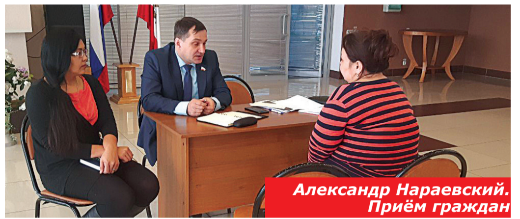
Александр Нараевский. Приём граждан