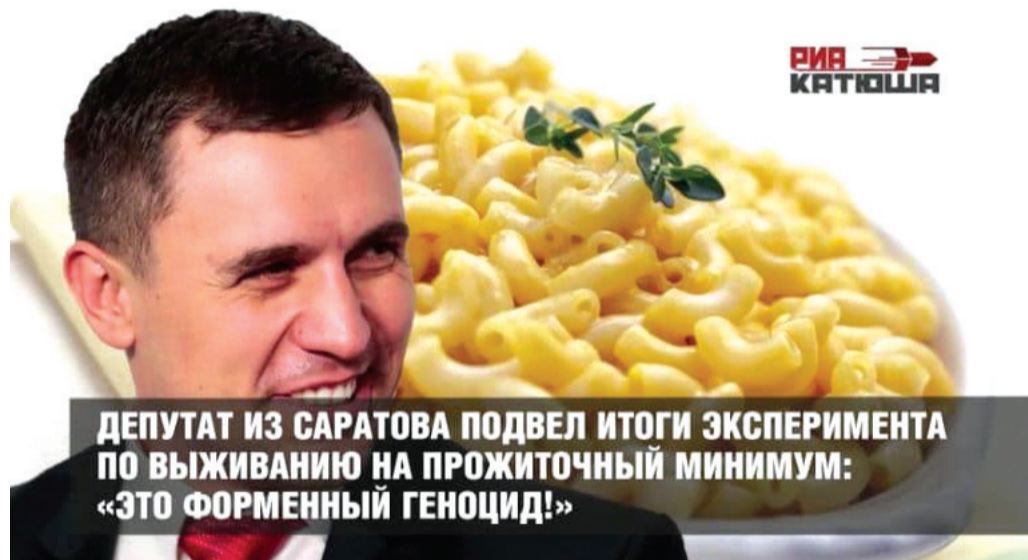
ДЕПУТАТ ИЗ САРАТОВА ПОДВЕЛ ИТОГИ ЭКСПЕРИМЕНТА ПО ВЫЖИВАНИЮ НА ПРОЖИТОЧНЫЙ МИНИМУМ: «ЭТО ФОРМЕННЫЙ ГЕНОЦИД!»