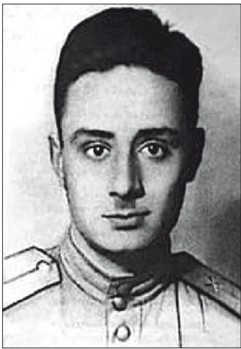
«Радость Вам сама протянет руки, если сердце доброе у Вас» Э. АСАДОВ.

7 сентября 1923 года в г. Мары, Туркмения, в семье интеллигентных учителей родился Эдуард Асадов.