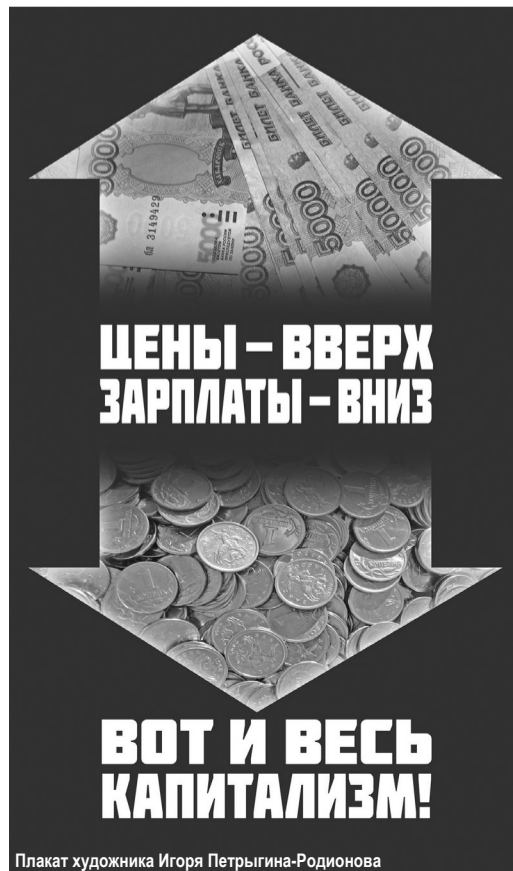
Плакат художника Игоря Петрыгина-Родионова