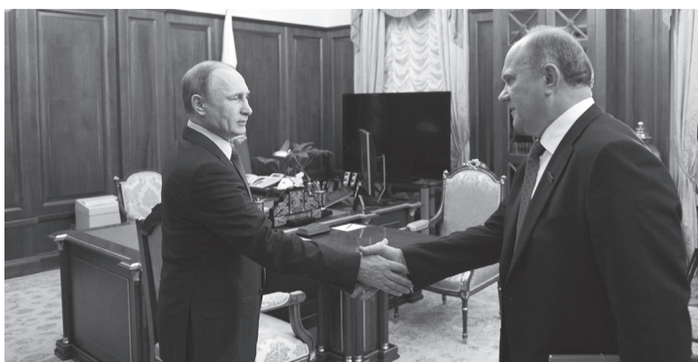
Президент Путин поддержал позицию КПРФ по «детям войны»

Накануне Нового года состоялась встреча Председателя ЦК КПРФ Г.А. Зюганова с Президентом РФ В.В. Путиным. Помимо других вопросов обсуждалась и проблема «детей войны».