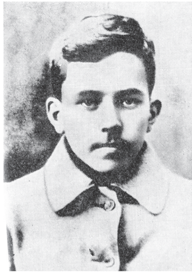
Николай Островский. 1918 год. На следующий год, 15-летним, он станет бойцом Первой Конной армии.

«Эту книгу знают во всём мире. Она сражалась вместе с бойцами интербригад под Мадридом, звала в бой отважных патриотов Кубы, поднимала боевой дух защитников свободы Вьетнама... Она издана на 60 языках мира.