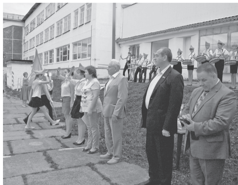
Торжественное построение по случаю закрытия сезона