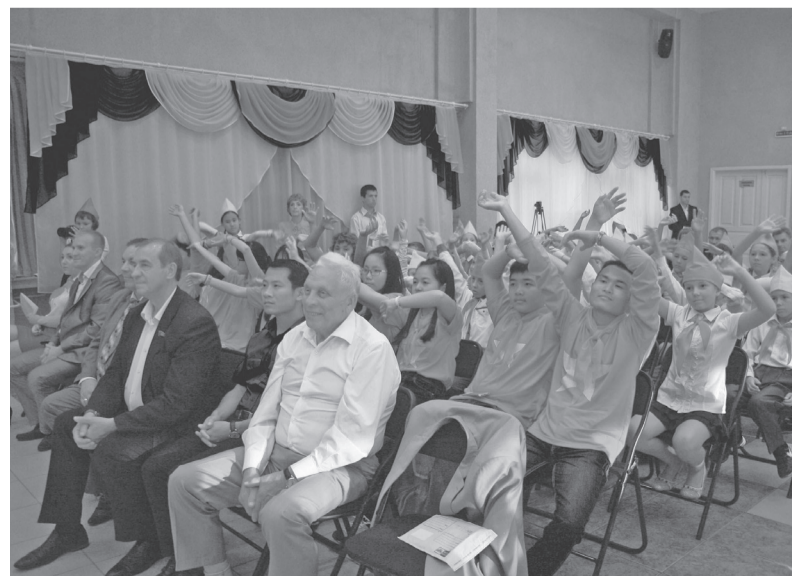
Исполнителям очередного номера помогает весь зал