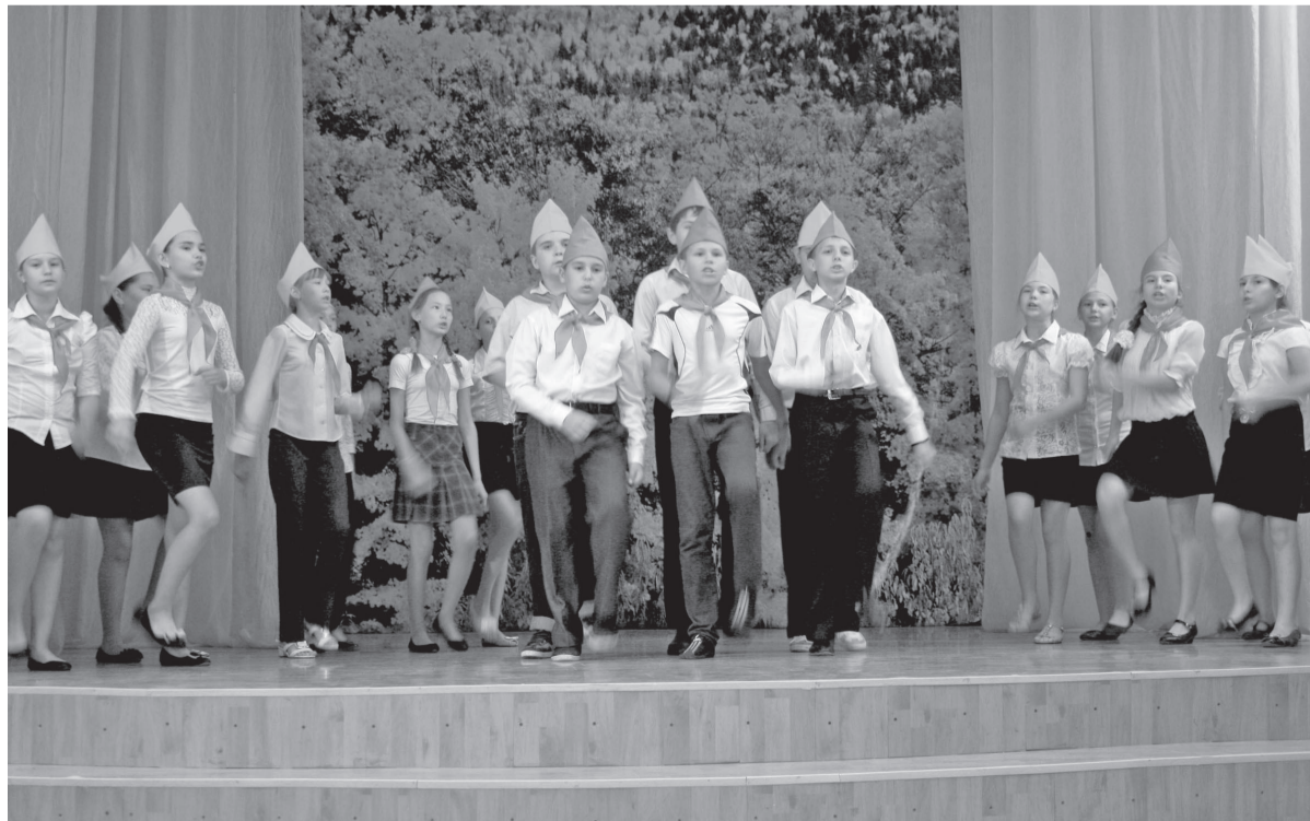
Хоровая пионерская песня «Служить отчизне» в исполнении ребят из отряда имени Вали Котика.

Александр ГЛУШКОВ. Фото автора. г. Байкальск, Слюдянского района.