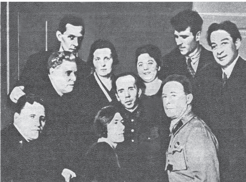
Н. А. Островский в кругу родных и близких. Москва, 1936 год.