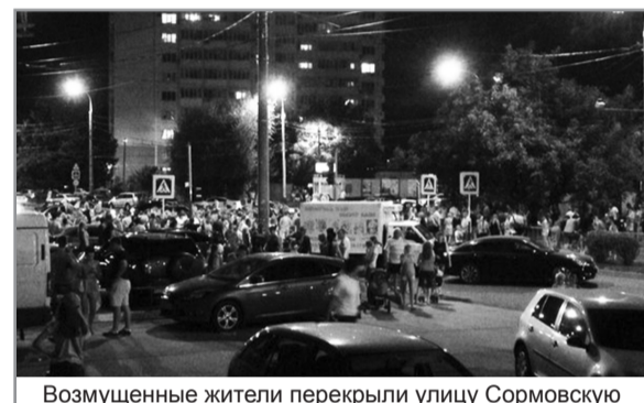
Возмущенные жители перекрыли улицу Сормовскую

За несколько дней телефон в народной приемной депутата Государственной Думы ФС РФ С.П. Обухова раскалится, как асфальт на солнце, от звонков изнемогающих граждан. Об отключении электроэнергии сообщали жители крайцентра с улиц Агротехнической, Черкасской, Восточно-Кругликовской, 1 Мая, Российской и других. Также сложившейся ситуацией озабочены жители нескольких садоводческих товариществ: «Ветеран», «Медик», расположенных в районе Ростовского шоссе, и жители поселка Калинино. В результате энергетического коллапса у горожан вышла из строя бытовая техника, испортились продукты.