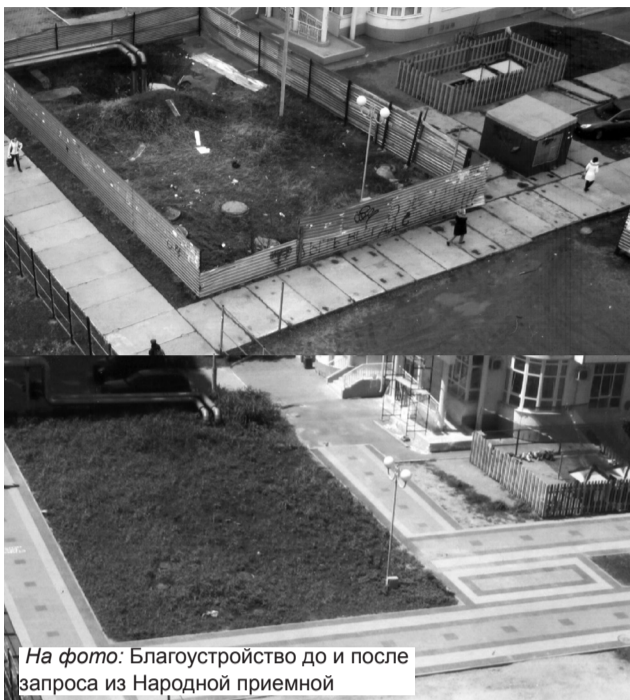
На фото: Благоустройство до и после запроса из Народной приемной