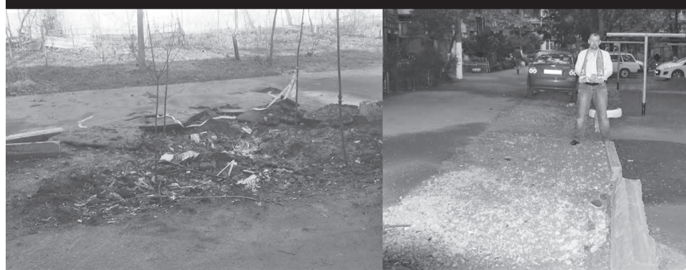
ДОЛГО БЫЛА ЯМА У ДОМА НА СТАВРОПОЛЬСКОЙ, 163. ПОСЛЕ ВМЕШАТЕЛЬСТВА КПРО ТЕРРИТОРИЮ БЛАГОУСТРОИЛИ