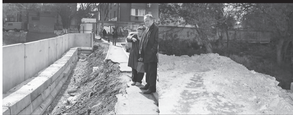
ОБРУШИВШИЙСЯ ТРОТУАР У ДОМА ПО УЛ.СТАВРОПОЛЬСКОЙ, 107/11 МЭРИЯ ВОССТАНАВЛИВАЕТ