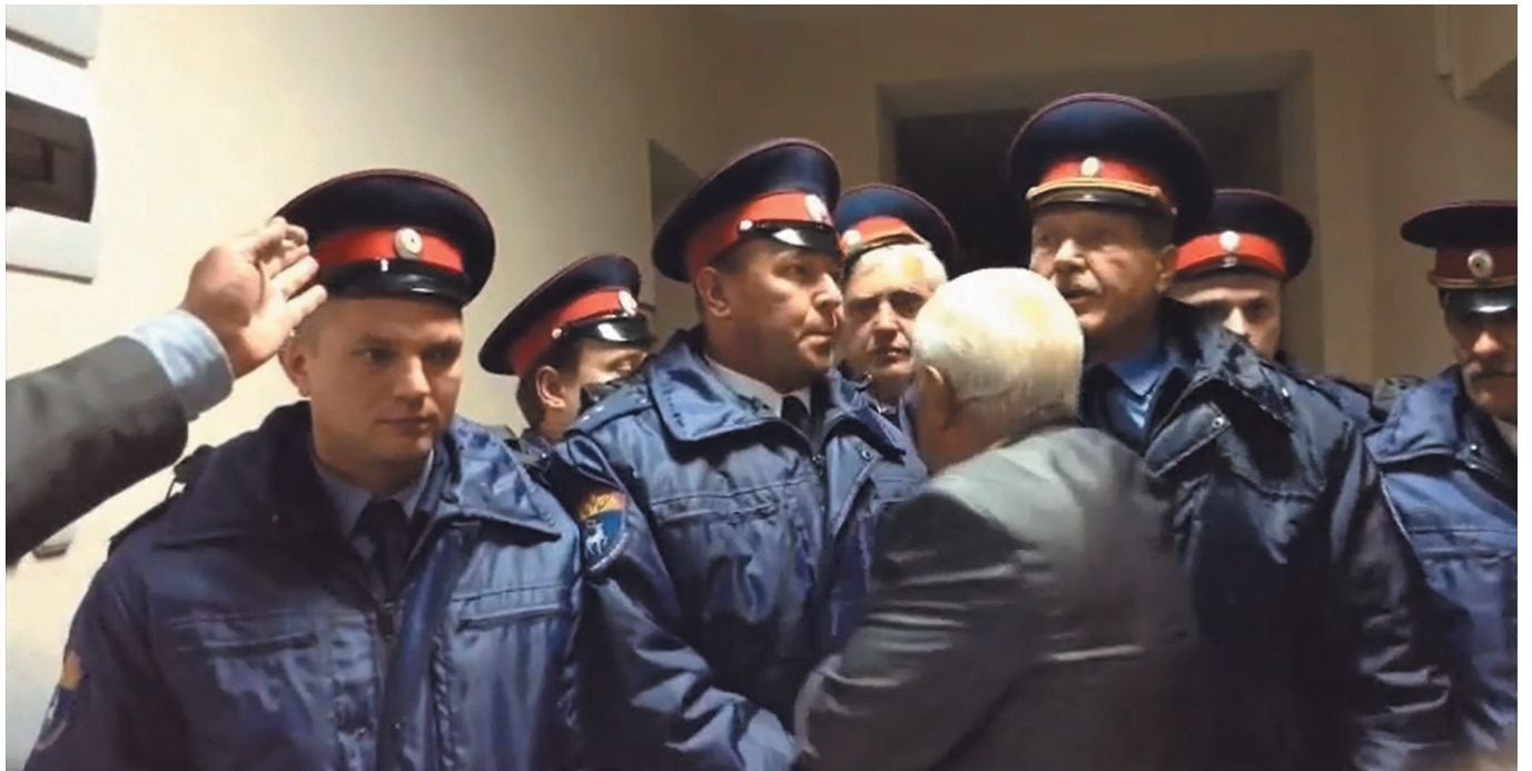
На фото: депутат ГосДумы от КПРФ В.А. Коломейцев пытается прорваться в помещение, где идет переписывание протоколов. Но помещение надежно охраняют люди в казачьей форме.

В день выборов реальная явка составила в основном 15–18% избирателей... С учетом результатов голосования по опросу избирателей при выходе с избирательных участков организованному преступному шахтинскому сообществу по проведению выборов показалось мало вброшенных бюллетеней, надо было делать явку и вытаскивать партию власти, и оно приступило к банальному вбросу бюллетеней открыто, у всех на виду, под охраной казаков и при бездействии полиции. Сначала протоколы переписывались во дворе администрации города со стороны ул. Клименко, а потом, после встречи депутата Государственной Думы